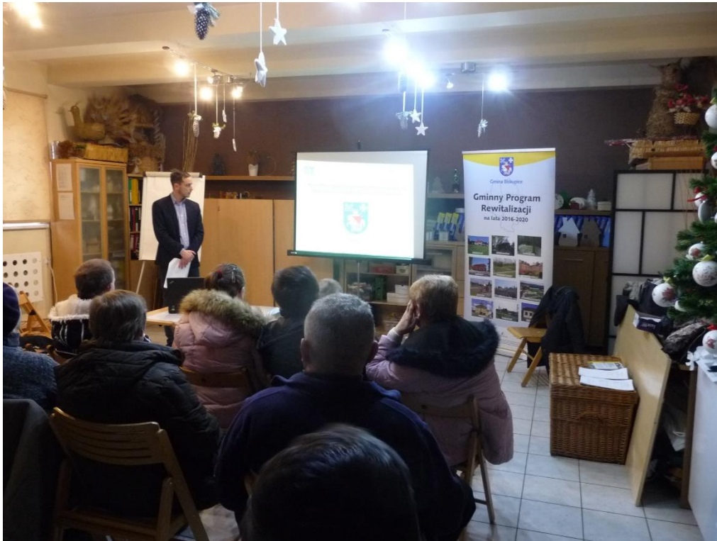
Warsztaty przeprowadzone w Sułowie w dniu 02.02.2017r.